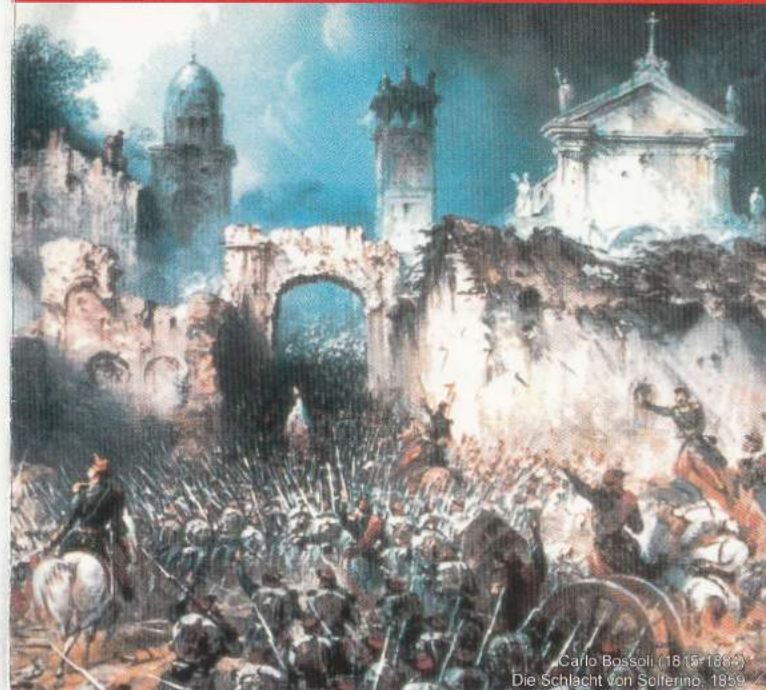
Carlo Bossoli (1815-1864) Die Schlacht von Solferino, 1859

Arbeitsgemeinschaft der deutschen Rotkreuz-Museen museum.drk.de