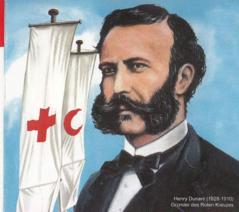
Henry Dunant (1828-1910) Gründer des Roten Kreuzes